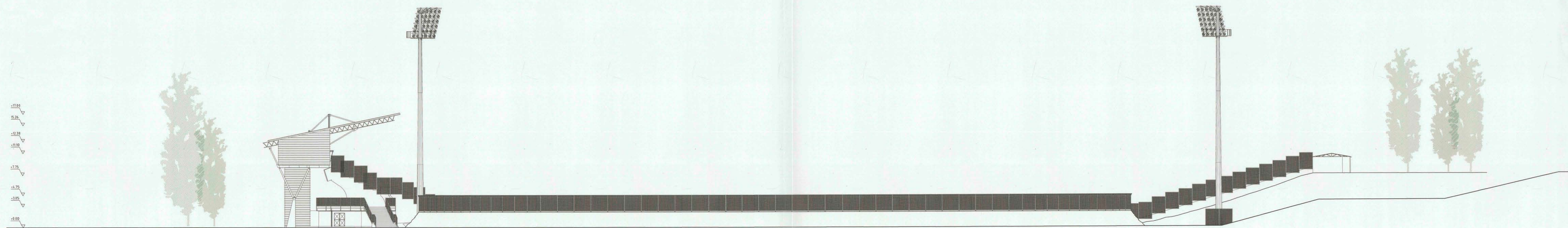
ESCALA 1:200 ELEVACIÓN SUR