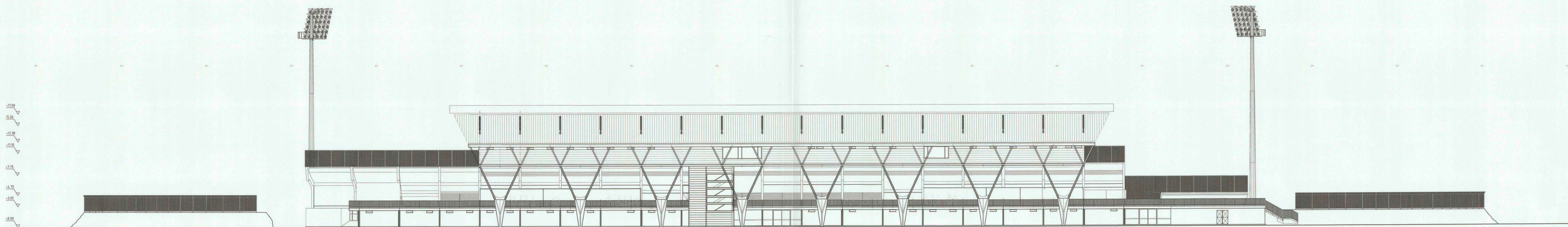
ELEVACIÓN PORTICO PONIENTE ESCALA 1:200