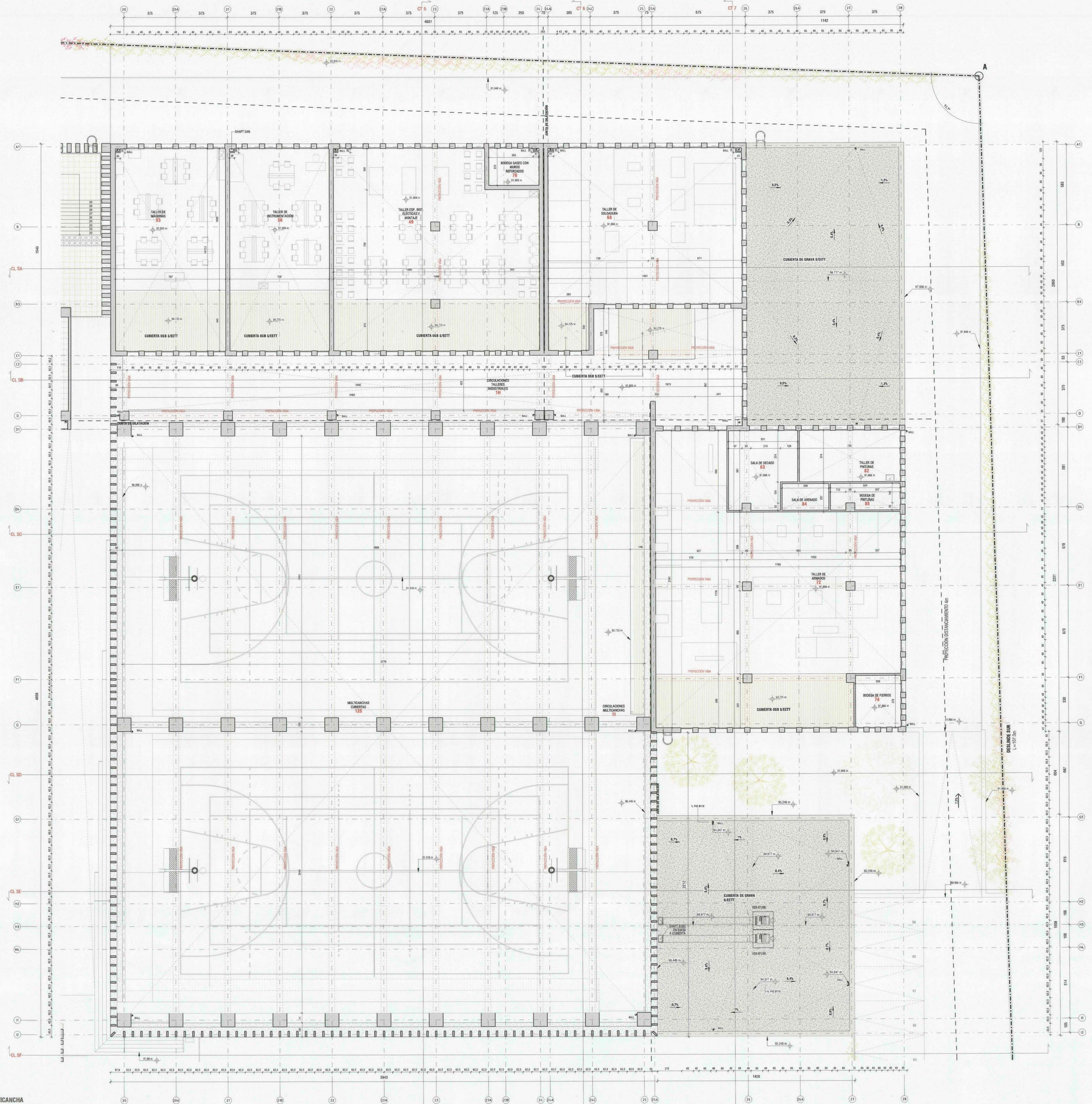
1 PISO 2 - SECTOR TALLERES INDUSTRIALES Y MULTICANCHA 1:100