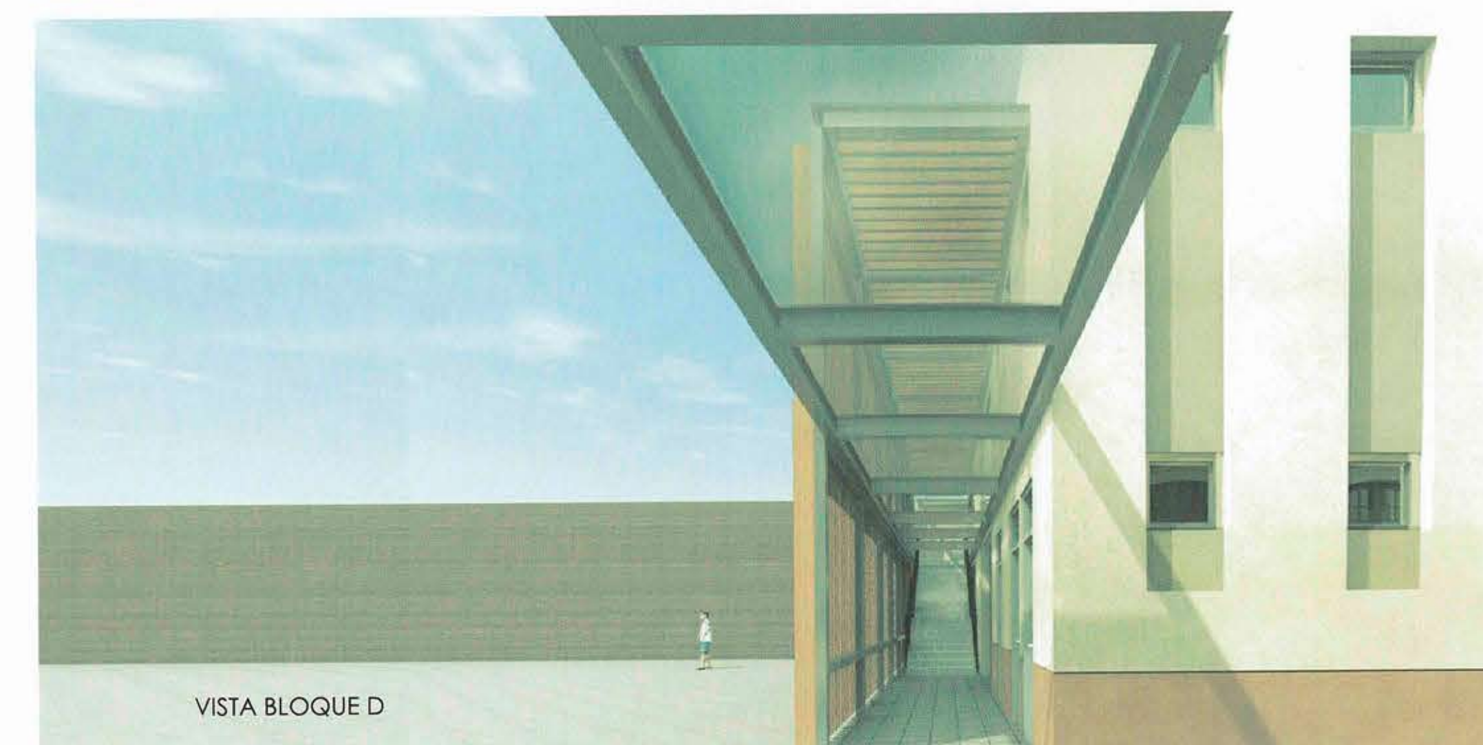
VISTA BLOQUE D