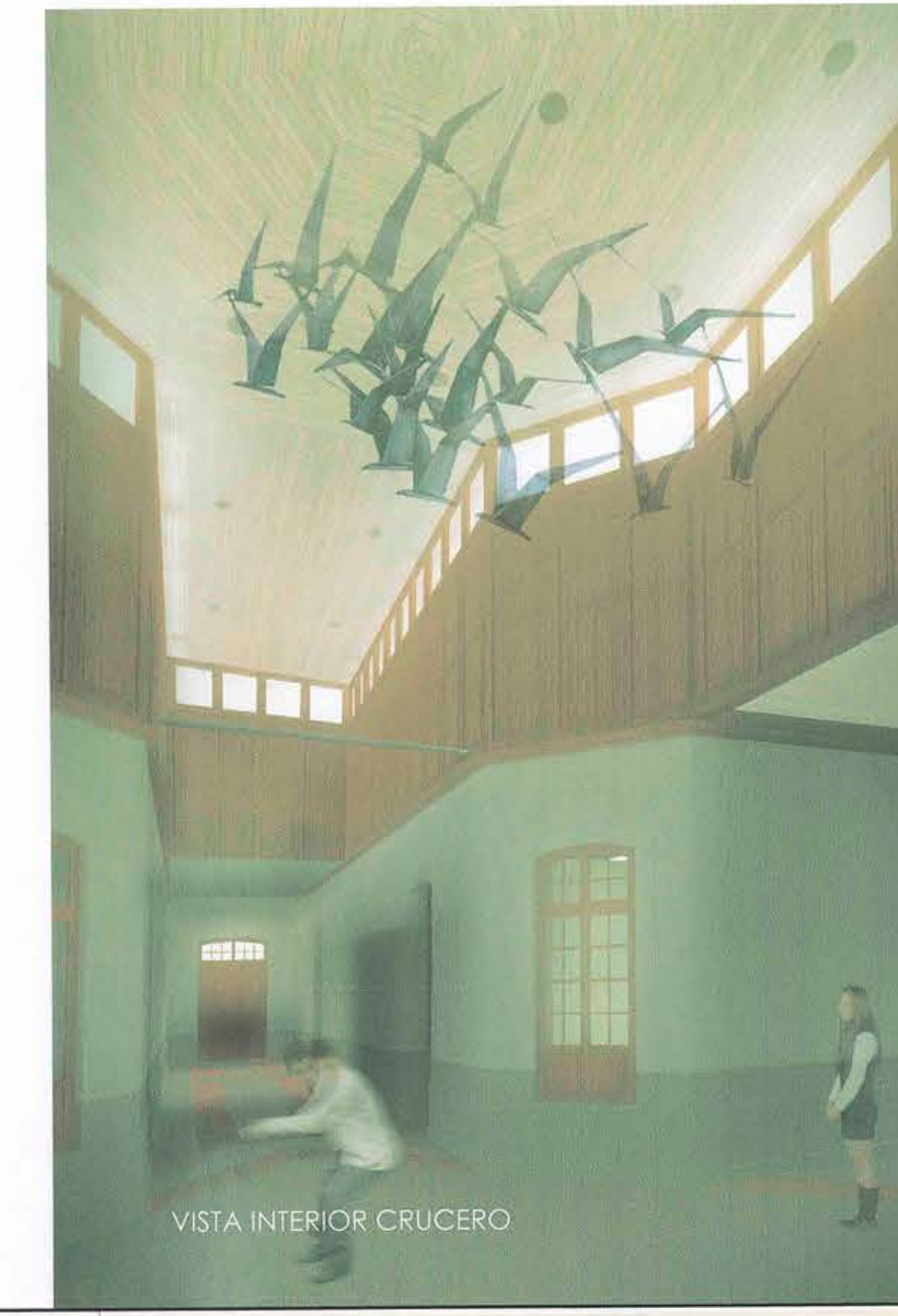
VISTA INTERIOR CRUCERO