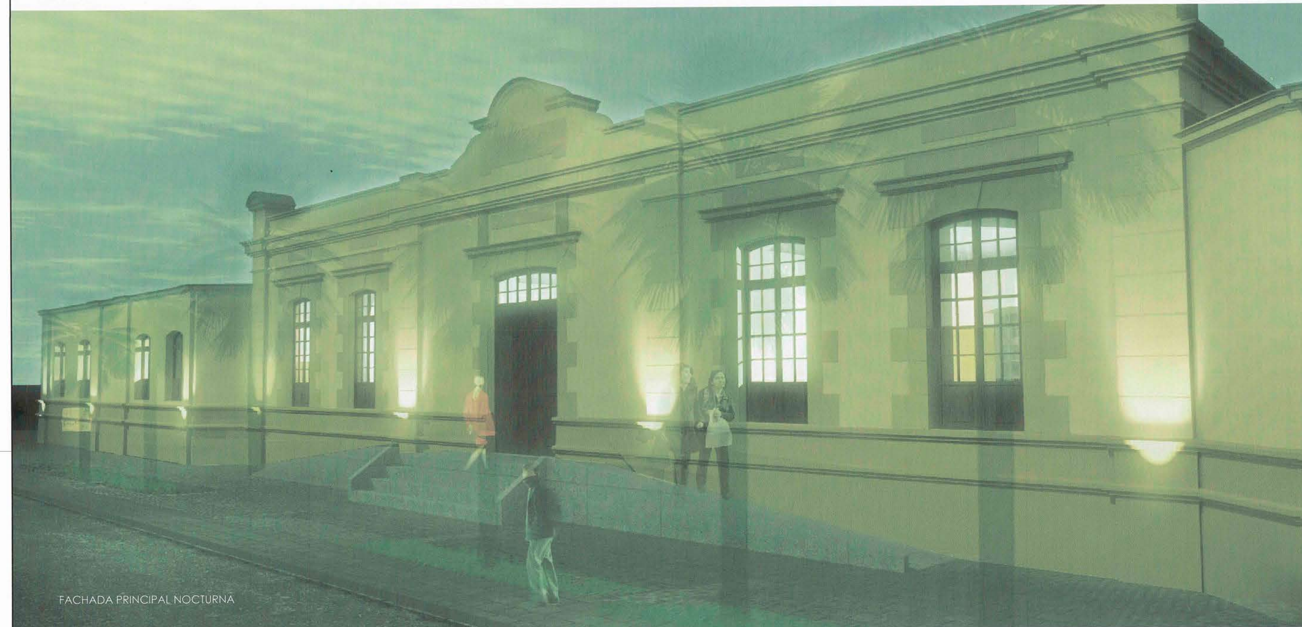
FACHADA PRINCIPAL NOCTURNA