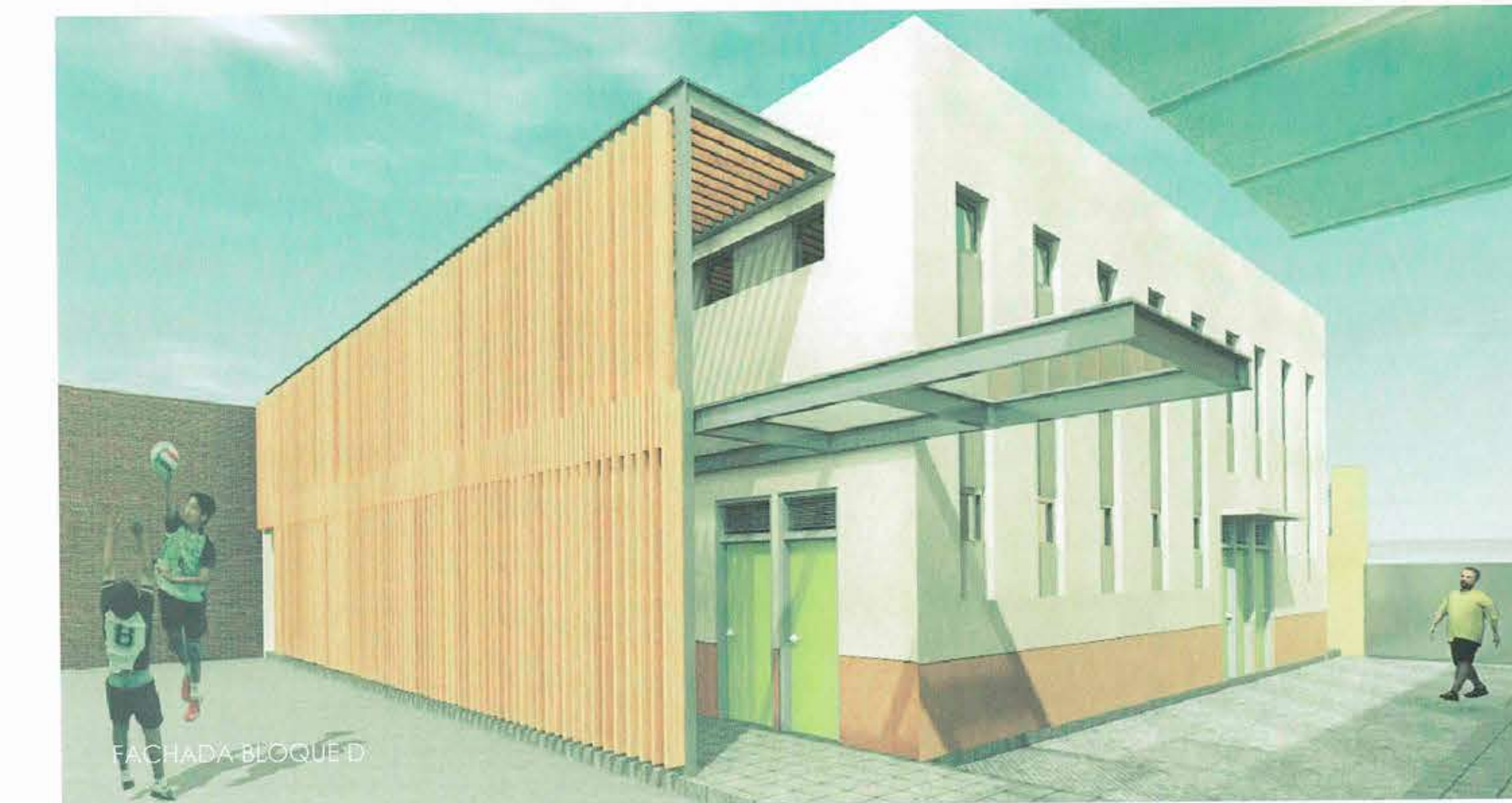
FACHADA BLOQUE D