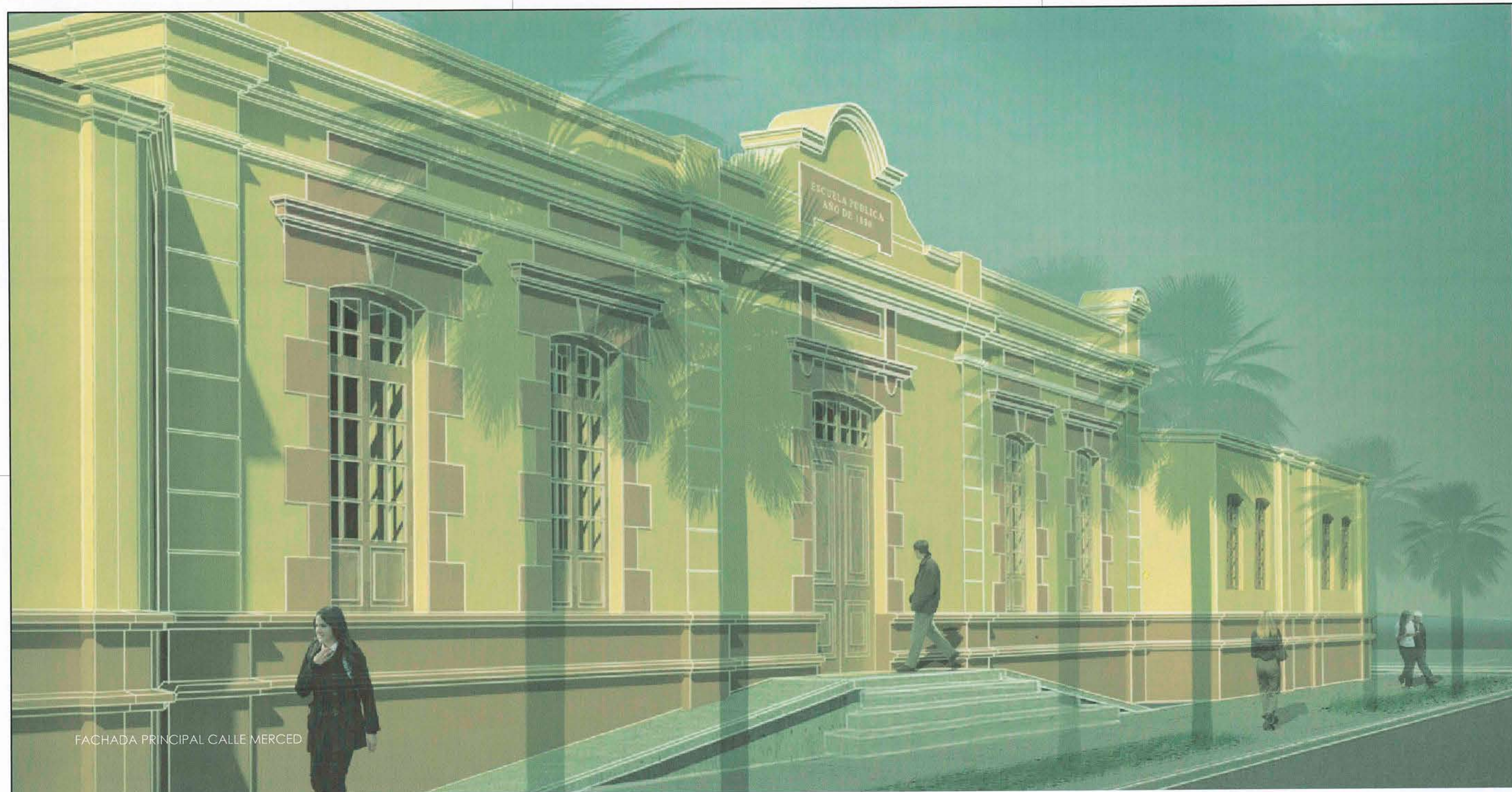
FACHADA PRINCIPAL CALLE MERCED