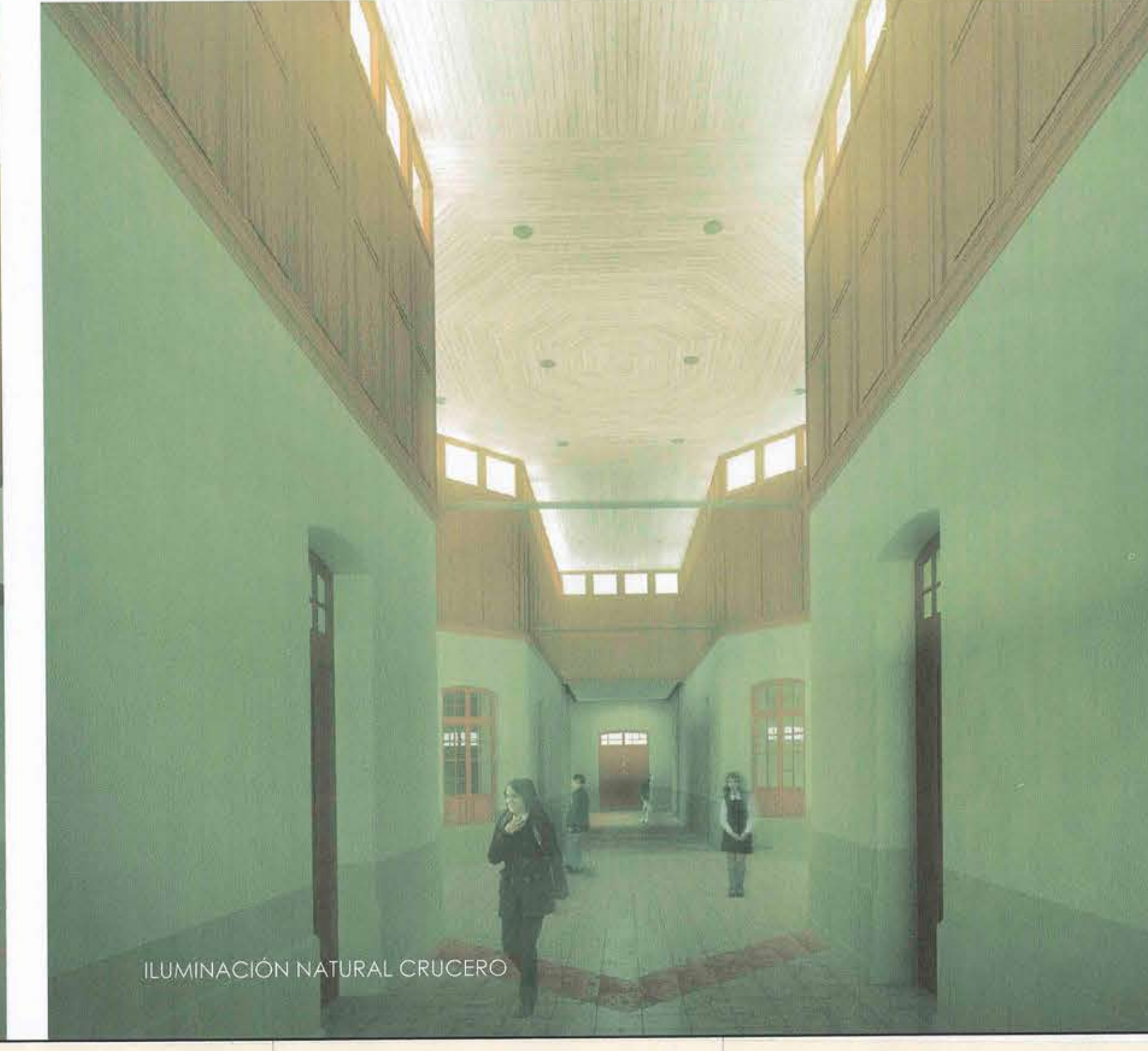
ILUMINACIÓN NATURAL CRUCERO