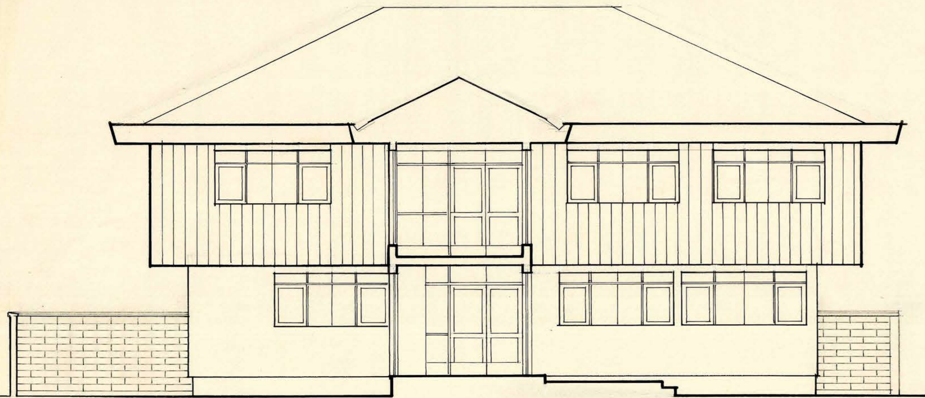
FACHADA NORTE DEL PABELLÓN "C"